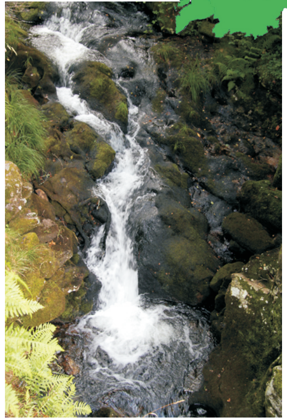
Fervenza dos Sete Muíños