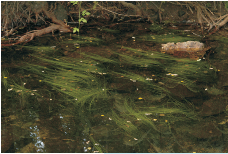
Isoetes fluitans , un fento acuático moi escaso