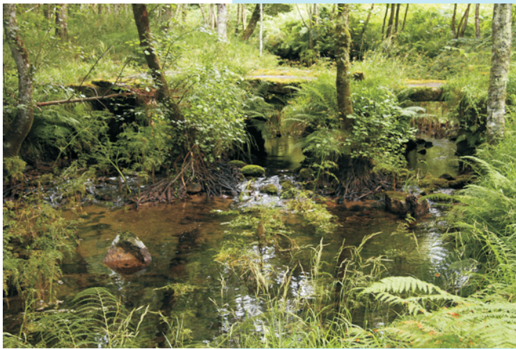
Ponte de Escádebas