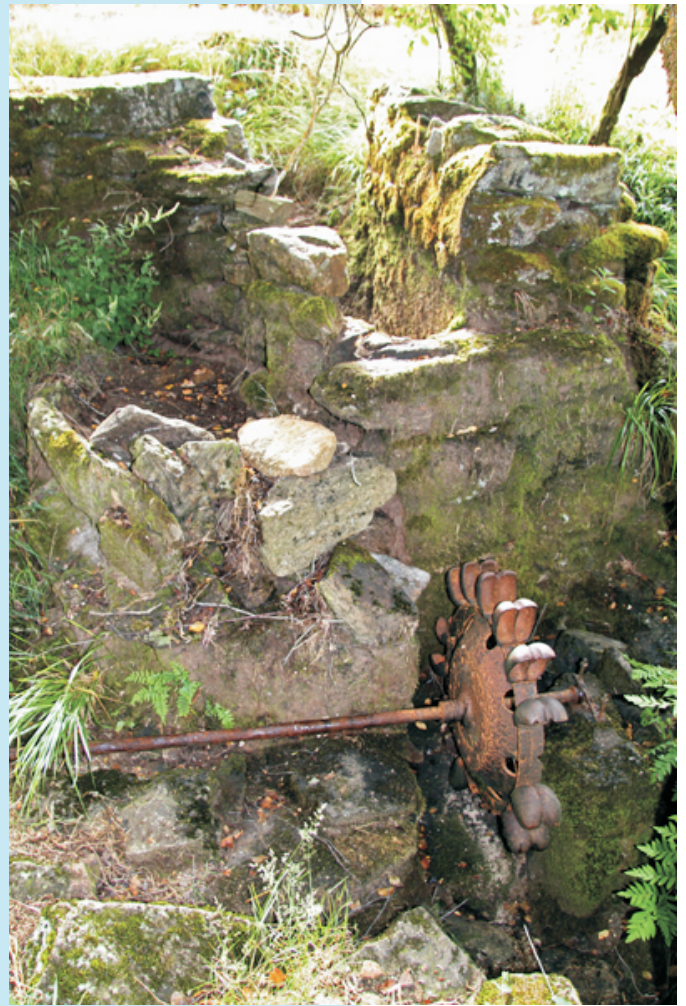
Restos dunha moa hidráulica para afiar aparellos do campo.