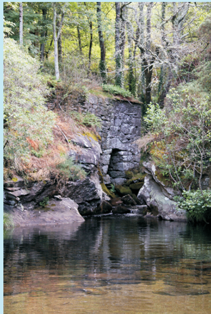
Área recreativa de Sete Muíños

Tamén se pode chegar camiñando desde Guitiriz por un sendeiro que remonta o río ata a área recreativa (forma parte dunha ruta máis grande, a "Ruta da Auga" que vai desde o Balneario de Pardiñas ata a ponte de Santo Alberte.